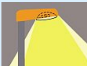
La pollution lumineuse est limitée et une bonne efficacité énergétique est garantie par un luminaire horizontal muni d'un réflecteur de lumière vers le sol à travers du verre transparent.