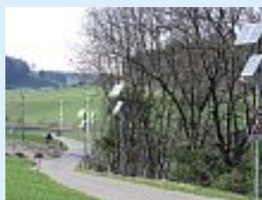
Pour l'éclairage des rues, la cité de l'énergie de Köniz produit son propre courant écologique. Les lampes solaires avec détecteur de mouvement sont indiquées pour l'éclairage de chemins piétons lorsqu'un raccordement au réseau électrique se révèle trop coûteux.

Vérifiez si l'éclairage public peut être alimenté en courant solaire ou en courant écologique certifié.