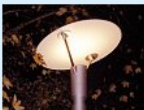
Un luminaire dont la lumière est diffusée indirectement au moyen d'un miroir (réflecteur secondaire) peut aussi engendrer de la pollution lumineuse. Veillez à ce que les lampadaires disposent d'un système lumineux et de réflecteurs adaptés évitant l'éclairage inutile des environs.