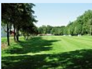
Une installation habile de l'éclairage (ici des lampadaires à droite de l'image) vous permet de vous servir des arbres ou des immeubles pour protéger les espaces sensibles de la lumière indésirable.