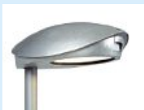
La lumière n'est diffusée qu'en direction du sol et le ciel n'est pas inutilement éclairé.