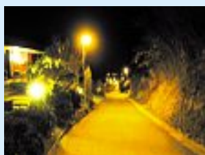
Gauche: conception d'éclairage discret dans la ville haute de Berthoud. Droite: éclairage excessif d'une ruelle peu fréquentée.