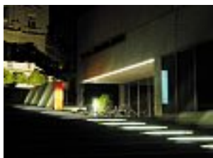
Conception d'éclairage discret à l'entrée du musée Franz Gertsch.