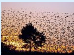
Les sources de lumière naturelle influent sur l'orientation des oiseaux migrateurs. Une lumière artificielle excessive les perturbe fortement dans leur vol et peut même les effrayer.

Peu de lampes doivent être allumées en permanence. Les panneaux publicitaires, les bâtiments illuminés et une partie de l'éclairage des rues peuvent être éteints, par exemple, lorsque la circulation a cessé. Si cela est impossible, alors l'intensité lumineuse peut au moins être réduite. Vérifiez que l'éclairage puisse être éteint dans les périodes écologiquement sensibles, par exemple lors des migrations aviaires, afin que les oiseaux ne soient pas induits en erreur.