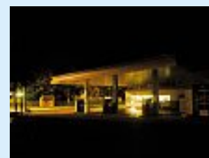
L'éclairage d'une station-service avec magasin située dans une zone d'habitation est éteint à partir de 22 heures (droite) et, si nécessaire, réglé par un plafonnier avec détecteur de mouvement intégré.