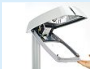
Lampe équipée d'un ballast électronique intégré.

Toutes les lampes à décharge (p.ex. les lampes à vapeur de sodium à haute pression, les lampes fluorescentes, les lampes à vapeur métallique) doivent être équipées d'un ballast qui limite le courant les traversant. Veillez à utiliser un dispositif électronique et non conventionnel.