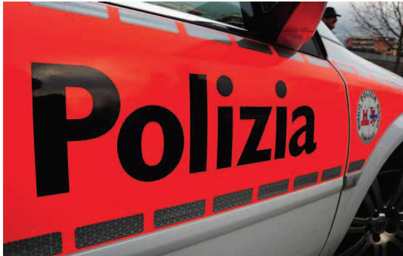
AUTOMOBILISTI UDITE UDITE Agenti di polizia dalla mano meno pesante.